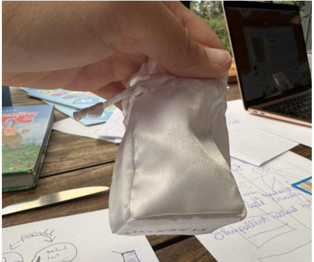
Näidis 2. Pildil on kõvapõhjaline, pealt nõõritav kott pusletükkide hoiustamiseks.

4.2.4 Mängunupud 5 tk , kogus 2500. Igas komplektis viis (5) mängunuppu. Mängunupud peavad olema üksteisest selgelt eristatavad värvi või muu visuaalse tunnuse poolest. Nupud peavad olema piisava suurusega ja ergonoomilised, et neid oleks lastel mugav haarata ja kasutada; liialt väiksed või kehvasti haaratavad, näiteks madalad nõõbi-kujulised nupud ei ole lubatud.