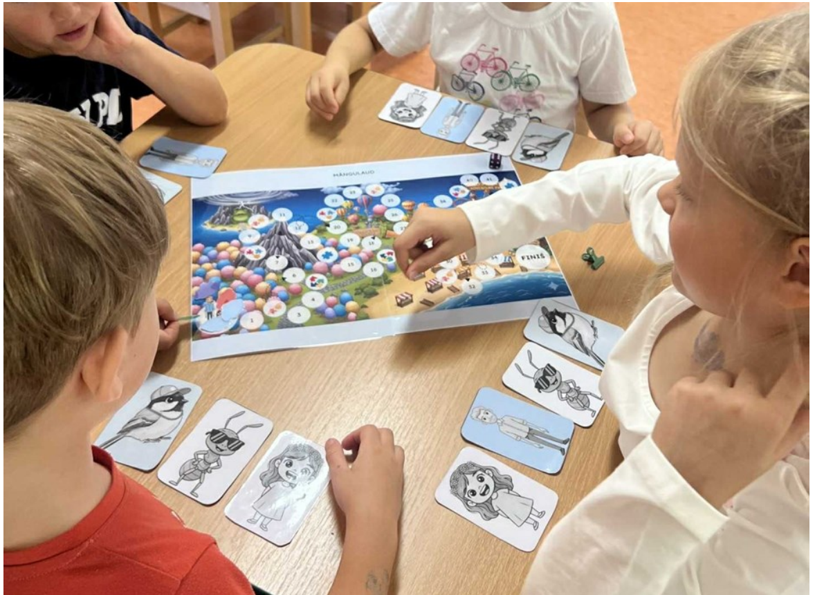
Näidis 1. Pildil on A7 suuruses kaardid, A3 suuruses lauamäng. Mahub lasteaedades kasutatavatele laudadele niimoodi neljakesi mängima.